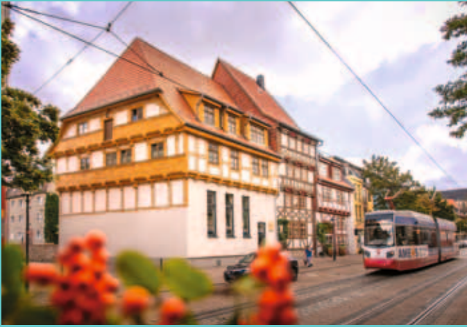
Gelebte Stadtentwicklung mit dem schönsten ausgezeichneten Fachwerkhaus Sachsen-Anhalts.