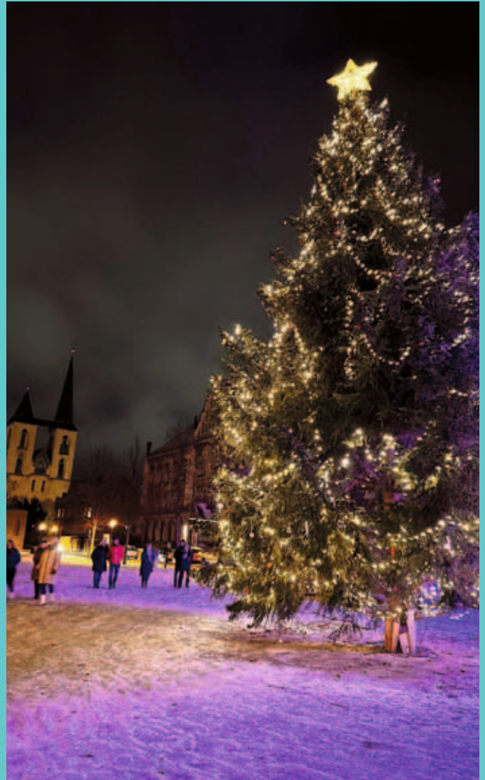
Seit Jahren läßt der CDU Weihnachtsbaum auf dem Domplatz die Kinderherzen höherschlagen.