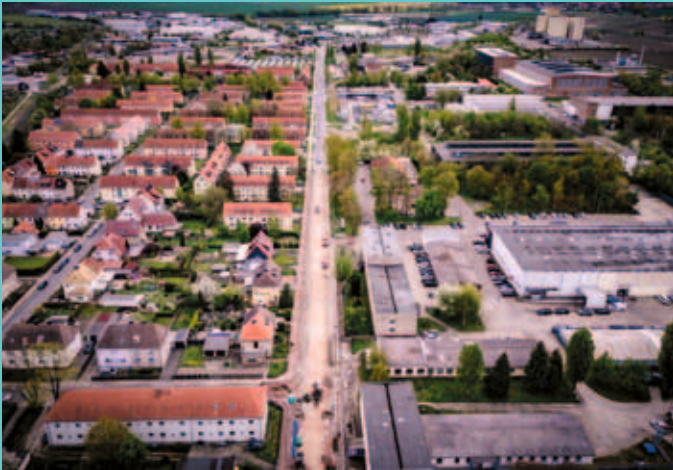
Rudolf-Diesel-Straße: Erneuerung der Straße mit Geh- und Radweg entsprechend dem Bürgerentscheid

Die CDU Halberstadt gestaltet diese Stadt prägend. Wir halten keine großen Reden oder polarisieren, wir packen an und setzen um. Das wird sich auch in Zukunft nicht ändern.