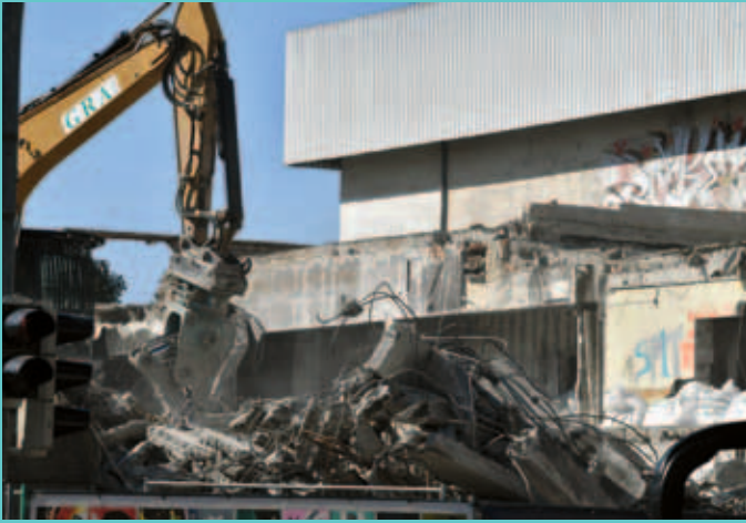
Andere reden - wir handeln. Verfallene Gebäude wie das Klubhaus und Möbel Boss weichen Neuem.