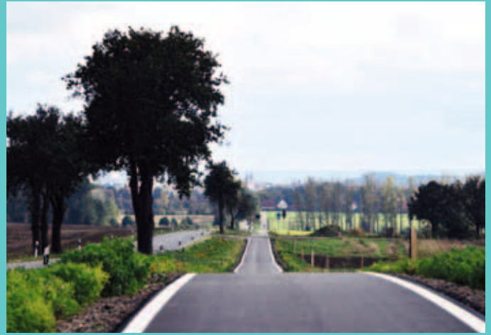
Gesund und nachhaltig - wir setzen uns für neue Radwege ein. Im Bild der Radweg von Sargstedt nach Halberstadt.