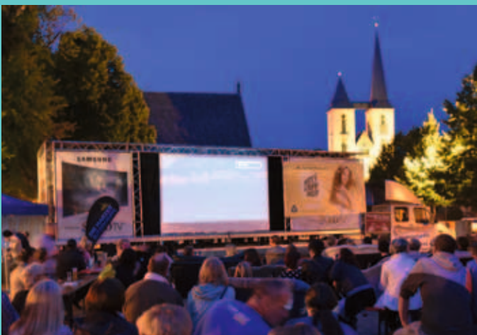
Die CDU macht das beliebte Sommerkino auf dem Domplatz möglich.