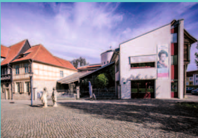
Wir sorgen für die finanzielle Unterstützung und somit für die Sicherung unserer Kulturstätten.