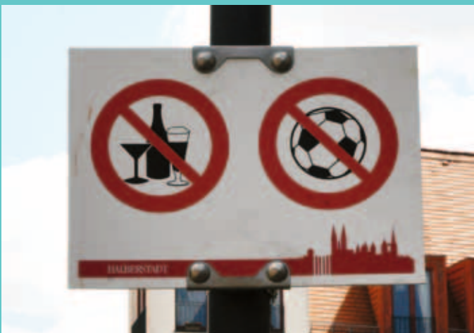
Alkohol- und Ballspielverbot auf dem Fischmarkt. Wir bringen Anträge in den Stadtrat, die wirken.