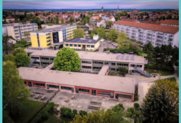
KITA Waldblick: Investitionen in unsere Kindergärten und Horte