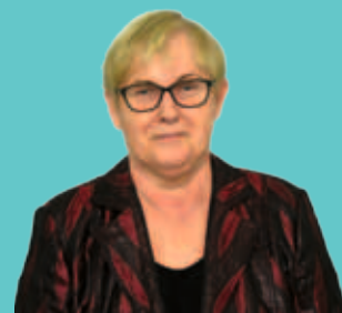
Frauke Weiß Landtags- abgeordnete a.D.