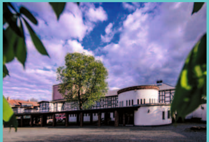
Die Förderung des Harztheaters steht auf sicheren finanziellen Füßen.