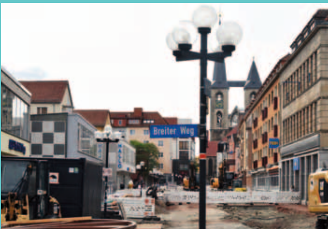
Ein Wunsch vieler Halberstädter erfüllt sich. Endlich wird der Breiter Weg saniert. Die Maßnahme ist das Herzstück der Innenstadtentwicklung.