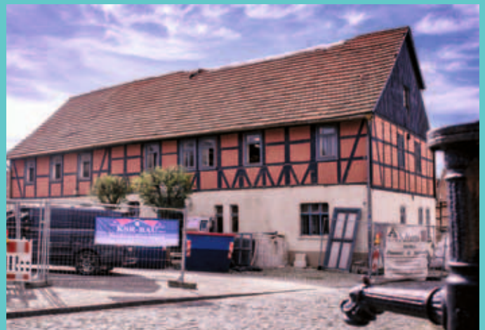
Das Bürgerhaus im Schachdorf Ströbeck steht für die Investitionen in unseren Ortsteilen.