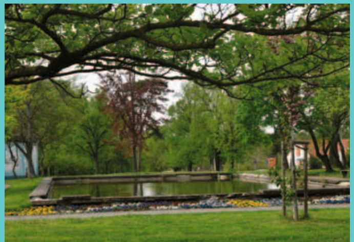
Wir arbeiten an der Sanierung des Brunnens „Am Breiten Tor“ und unterstützen die entsprechende Spendenaktion.